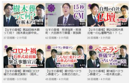
なすの斎場グループの公式 YOUTUBEチャンネルの画面

今後も様々な話題に触れていきたいと思っていますので今後配信される動画にもご期待ください！