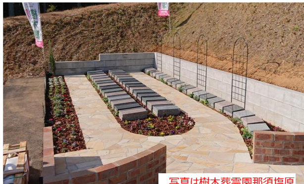
写真は樹木葬霊園那須塩原