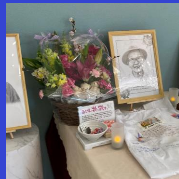
遺影写真からアートレイト（似顔絵）を作成し展示いたしました

A. 施設にもよると思いますが、母がお世話になっていた「木の実デイサービス」さんは沢山の写真を撮ってくれていました。自然体で笑顔が素敵な写真が沢山ありました。そのお陰で遺影写真選びで迷いませんでした。元気な時にお写真を撮っておくことをお勧めします。