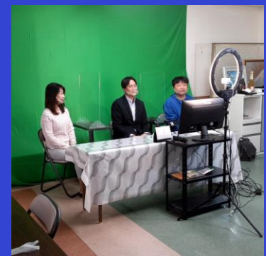
みんなの那須ポータルサイト出演の様子