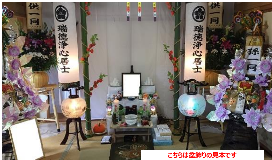
こちらは盆飾りの見本です